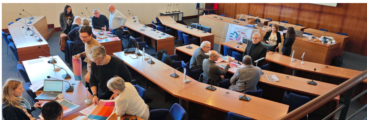
▲ Atelier de concertation au siège du Grand Longwy (Agglomération du Grand Longwy)